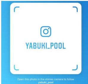
矢吹町温水プール