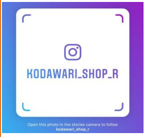
こだわりショップR