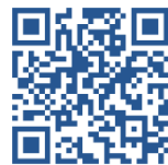
矢吹町温水プール