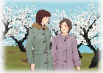
添田さん親子（白河市）